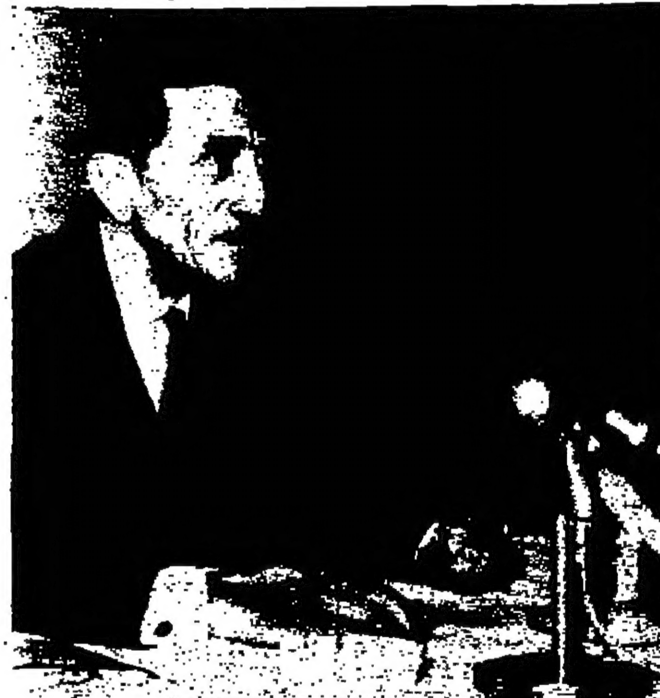
السيد روجي الخطيب امين القدس يتحدث الى رجال الصحافة في مؤتمره الصحفي امس

بغداد - اقليمية - تحدثت صحيفة « المثل » الاسبوعية عن خطوات شاملة قامت اتهاوضعت للتنسيق السياسي والعسكري والاقتصادي بين العراق والاردن والجمهورية العربية المتحدة .